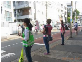
6月9日(土)もみじ山通り天神交差点

スクールゾーンの交通規制が適用されない学校公開のある土曜日の安全を見守ります。皆さんはユニフォームを着用し、「登校時間です」と書かれたプレートを手を持って、ドライバーに交通安全を呼び掛けていました。