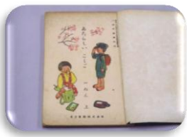
1年生のこくごの教科書