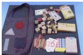
1年生のさんすうセット

校舎正面に「内」「外」の看板があり、雨の日には「内」、校庭で遊んでよい日には「外」の看板が掛けられていました。授業の始まりと終わりにベルが鳴りましたが、壊れて鳴らない時には用務員さんがチリンチリンと鐘を鳴らして知らせていました。廊下には白線が引かれ、右側通行が定められ、「走るな」という掲示が各所に貼られていました。冬の暖房はだるまストーブ。石炭を燃やし、外まで長い煙突が伸びていました。1年生のこくごの教科書は「さいたさいたさくらがさいた」から始まりました。さんすうの教材に入っていたサイコロは双六に使い、長く遊んだことを記憶しています。(次号につづく)