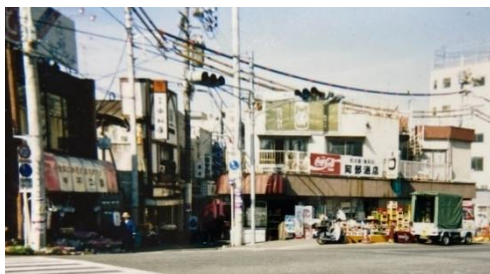
平成初め頃の東中野ギンザ通り入り口