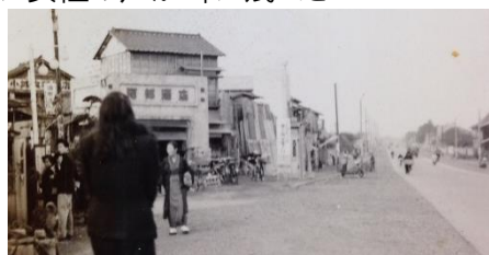
昭和28年頃の東中野ギンザ通り入り口 看板のお店は「阿部酒店」

「私の住んでいる東中野は変な町なのよ、スーパーが一軒もないの」。チャンと言えば総武線直通中央線の、いわゆるドンコウの電車の中での若い女性の声が耳に残った。