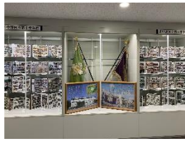
三中と十中の記念コーナー