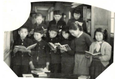
卒業アルバムより