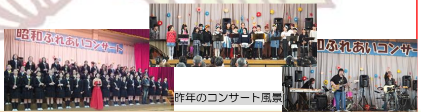
昨年のコンサート風景