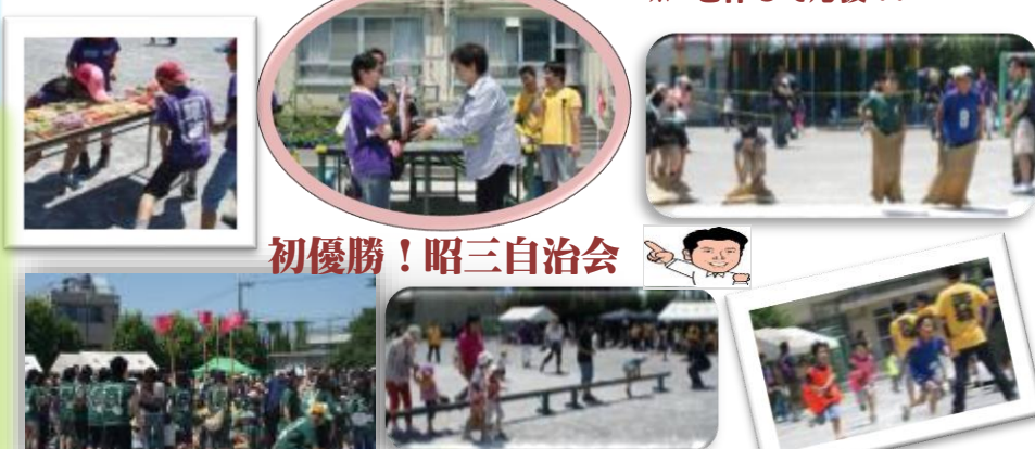
カレーを作って応援!!