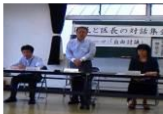
「区民と区長の対話集会」開催の冒頭での区長ご挨拶

6月19日(水)午後2時から当センターにて、“自由討議”の対話集会が開催されました。環境・防犯・行政等、意見の交換がおこなわれました。