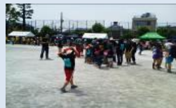
第15回 昭和5町会ファミリー運動会

当日は晴天であり、予定通り6月9日(日)に桃園第二小学校にて、開催されました。名前の通りファミリーで参加をし、改めて地域と家族の絆づくりの輪の大切さを感じました。優勝は打越町会でした。